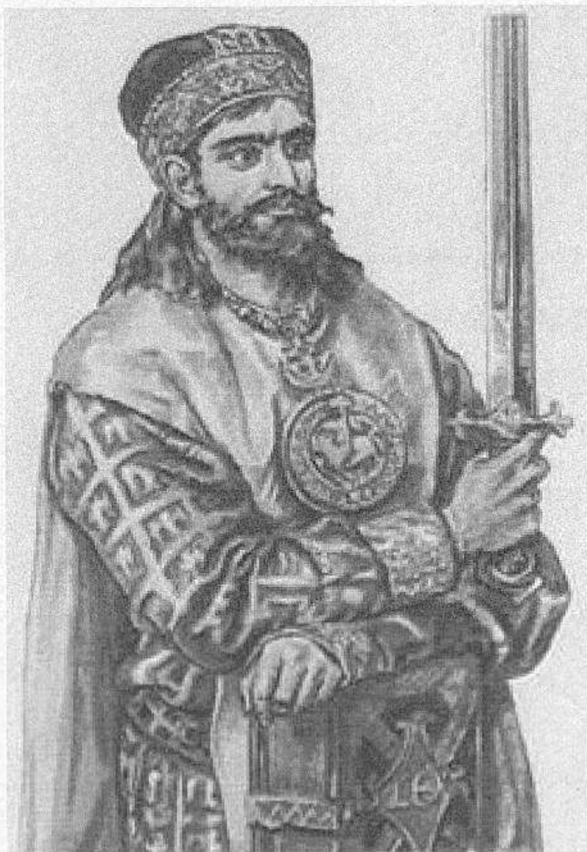
KSIĄŻĘ KAZIMIERZ SPRAWIEDLIWY(1138-1194)

w r. 1191 ustalił płacenie przez Mąkoszan podatku na rzecz Kolegiaty Sandomierskiej.