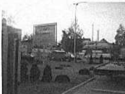
Ocynkownia Ognłowa Zakład Mechaniczno-Odlewniczy

W ostatnich latach nastąpiła zmiana struktury społeczno-gospodarczej wsi. Wcześniej większość mieszkańców była chłoporobotnikami. Robotnicy utrzymywali się z pracy na roli i w zakładach przemysłowych Radomia. Obecnie dochód z rolnictwa stracił na znaczeniu. Około 50% pól leży odłogiem. Wielu mieszkańców wyjeżdża do pracy za granicę (ok. 30 osób). Tylko niewielka część owadowian para się rolnictwem, znaczna część żyje z rent i emerytur. Powstały nowe podmioty gospodarcze; zakłady produkcyjne, usługowe oraz handlowe, w których znajdują zatrudnienie mieszkańcy wsi.