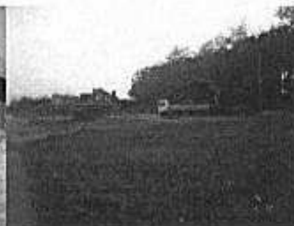
PPIU „SALEX” Budownictwo